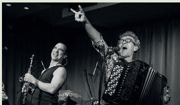
VINCENT WESTPHAL/VINCENT GAFFET